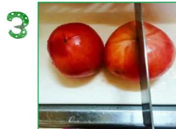
十字に切り込みを入れる