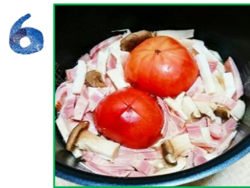
ベーコンときのことトマトを炊飯器に入れ、炊飯スイッチを入れる