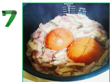
ご飯が炊けたら、トマトを潰しながら混ぜます