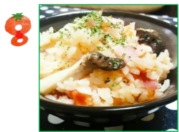
盛り付けて、ブラックペッパーや乾燥パセリ等をふりかけたら出来上がり