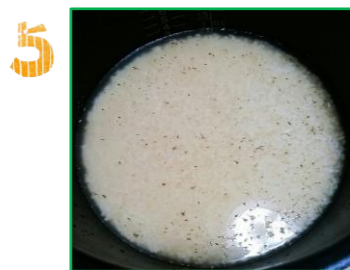
①の炊飯器に【調味料】を入れ、混ぜ合わせる