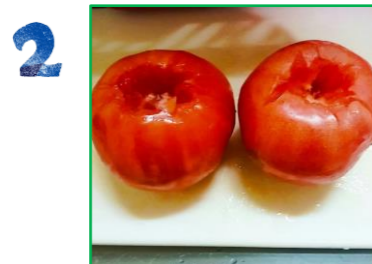
トマトのへたを包丁で切り落とす

1 お米を洗ったら、4合の線より少なめに水を入れ炊飯器にセットする （炊飯スイッチはまだ入れません）