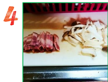
ベーコンは細切りにして、キノコは洗って手でさいておく