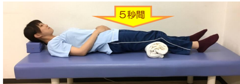
②バスタオルを膝で押して太ももの前面に力を入れる。