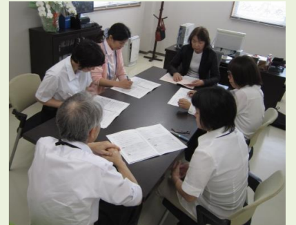
もみの木ケアプランセンター もみの木相談支援センター

私たち介護・福祉関係の事業所の職員は毎年「虐待・身体拘束のチェックリスト」を実施し、私たちがそれを行っていないか、利用者様がそういった行為をされている可能性がないかを確認しています。利用者様をお守りすることにつながる大事な内容ですので、今回の勉強会を機に再度気を引き締めて業務に励んでいきたいと思ひます。