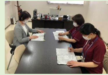
もみの木ケアプランセンター

今月は「質の高い対話」について勉強しました。利用者様の計画を立てる際、たくさんのお話を聞き、ご本人やご家族の希望や意向を踏まえた上で、ご本人が「自分らしい人生だ」と思えるような計画にすることが大切です。しかし、自分の意思・希望・自分らしさといった、はっきりとは答えにくい内容については信頼できる関係性の相手にしか語れないものです。