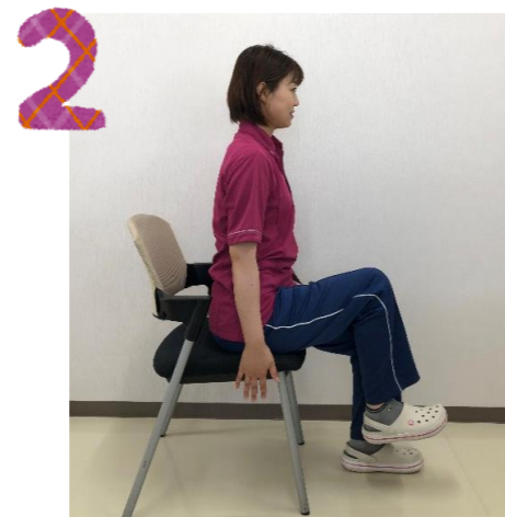
膝を胸に近づけるように足を上げる