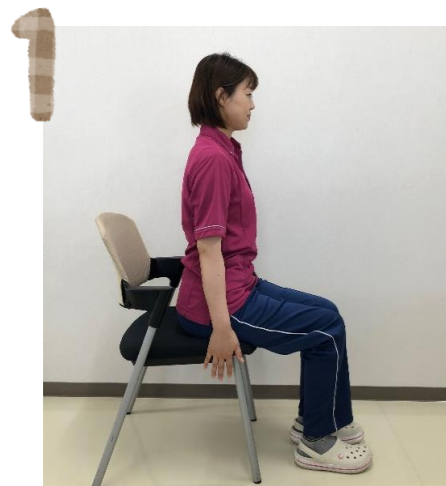
骨盤を起し背筋を伸ばす