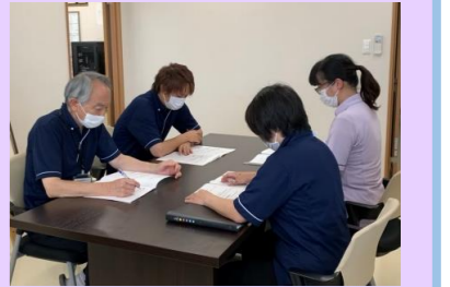
もみの木相談支援センター

相談支援専門員の仕事は、面談が主となる相談援助職です。その行動規範として有名な「バーステックの7原則」と呼ばれる定義について学習しました。