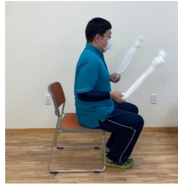
椅子に浅く座り、姿勢を正します。 近くに物が無い状況で実施して下さい。