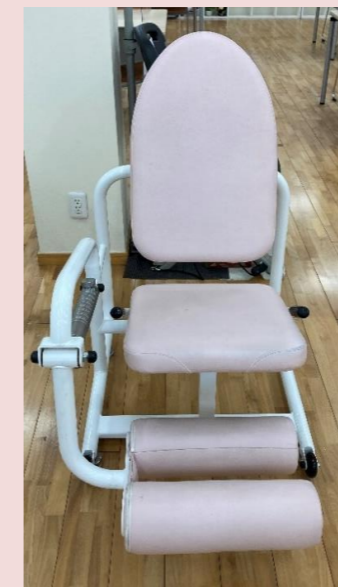
レッグエクステンション

自転車型の運動機械です。負荷を設定できるので、無理なく下肢の筋力トレーニングが出来ます。