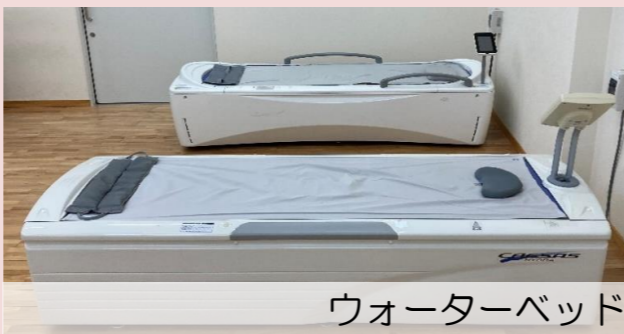
ウォーターベッド

低周波電流を流し、筋肉が収縮と弛緩を繰り返すと、血流が促進し、痛みの軽減に繋がります。疲れやコリを和らげる効果もあります。